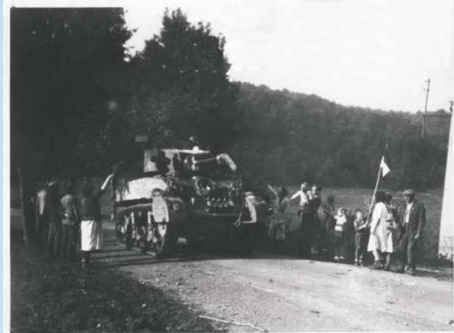
Foto 2: Jetzt sind sie da! Der erste US-Panzer (M5A1) rollt aus Richtung Mühle heran und nähert sich der Abzweigung nach Schoos, respektiv Dorfmitte.

Foto 1: Die Einwohner Fischbachs in freudiger Erwartung der amerikanischen Befreier.