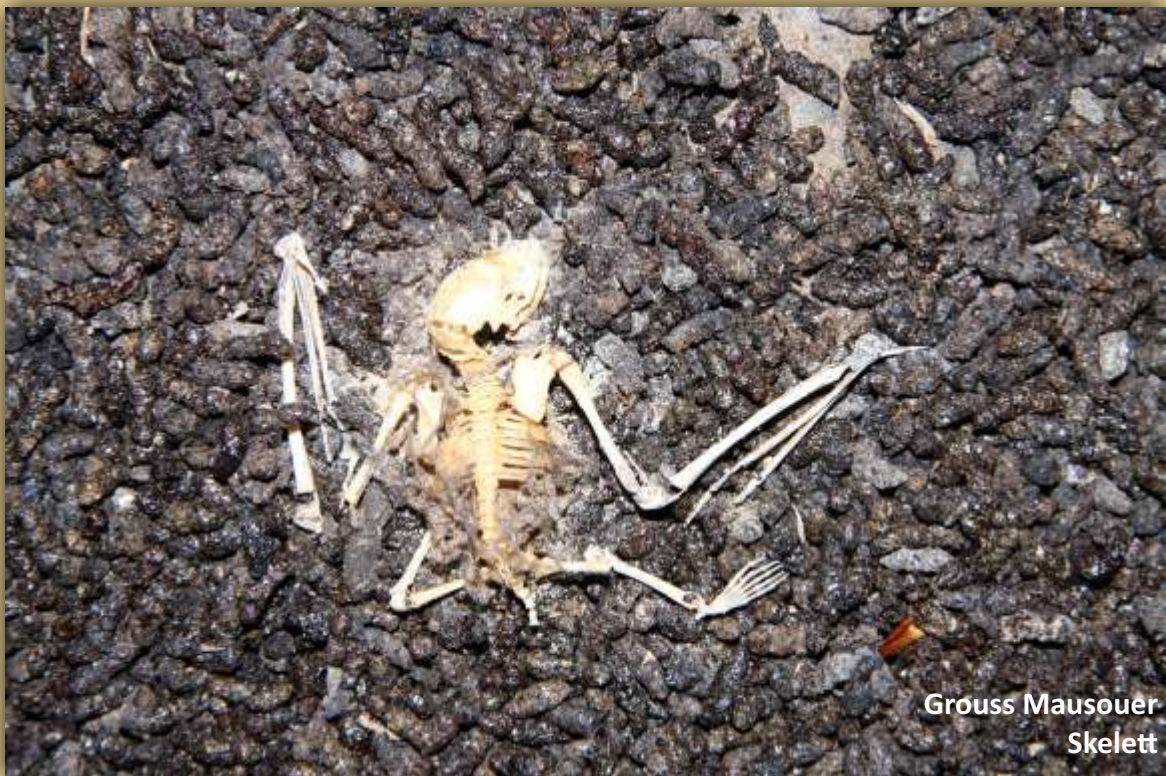
Grouss Mausouer Skelett