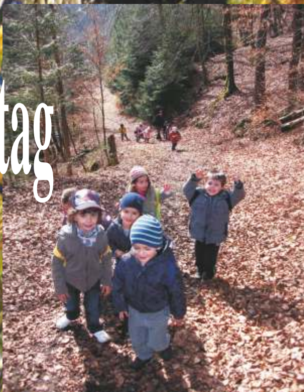
Wanderung in Schoos, der Berg war steil... Précoce