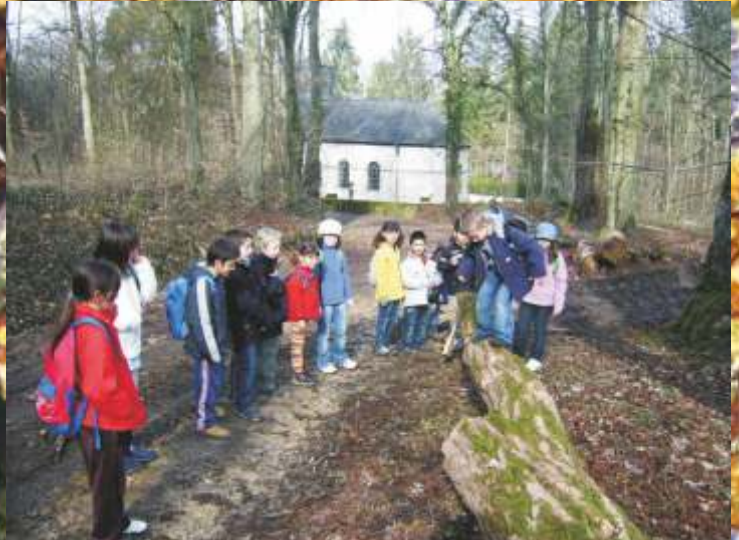
Fitnessparcours im Wald Zyklus 2