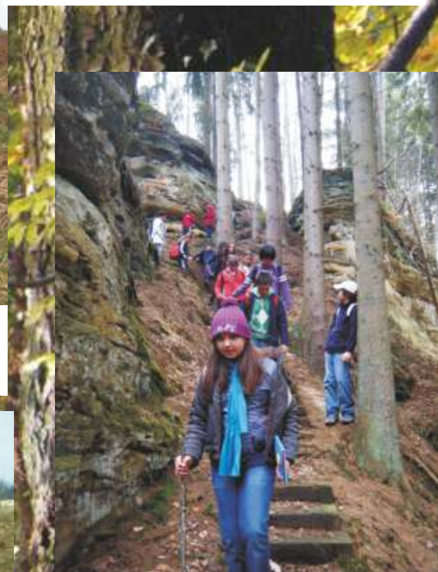
...über Stuppicht nach Fischbach, Schoos und zurück nach Angelsberg Zyklus 4