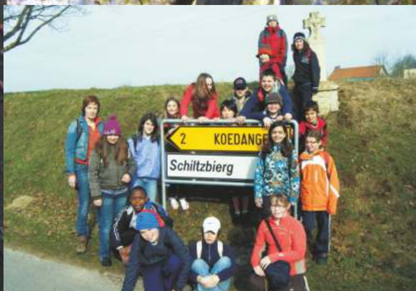
Wanderung von Schiltzberg über Koedange nach Weyer... Zyklus 4