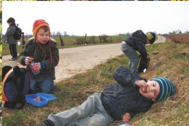
...und die Pause verdient .... Précoce