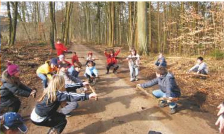
Trimmparcours in den Wäldern rund um die Schule Zyklus 3

Einmal im Jahr legt das Unterrichtsministerium einen Schulsporttag fest. Dieses Jahr unter dem Motto „GEHEN“. Unsere Schule beteiligt sich regelmäßig daran. Hier nun ein paar Eindrücke vom sportlichen 24. März 2010: