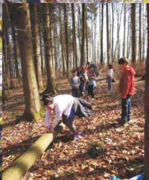
...es geht auch ohne Fitnessstudio... Zyklus 3