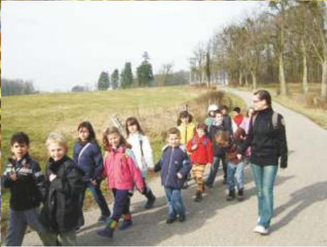
Wanderung über Meyseburg nach Ernzen Zyklus 2