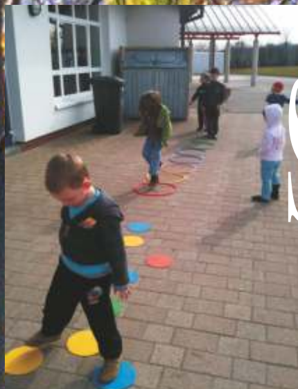
...nachmittags gab es Bewegungsspiele im Schulhof... Spielschule